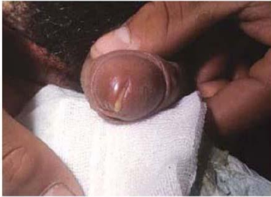
Figura 4. Gonorrea masculina: uretritis gonocócica, secreción uretral purulenta.